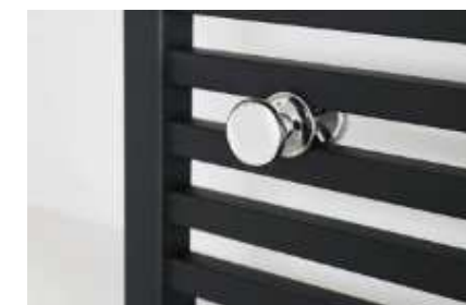
TUBES ET COLLECTEURS CARRÉS